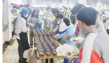
发送对象:宜春中学全体师生 印刷单位:宜春市同茂印务有限公司 印数:400份

腊八佳节,相约食堂,赴一场粥香之约;日常三餐,走进食堂,享一份暖心美味。宜中食堂,与你共赴暖冬,相伴同行!